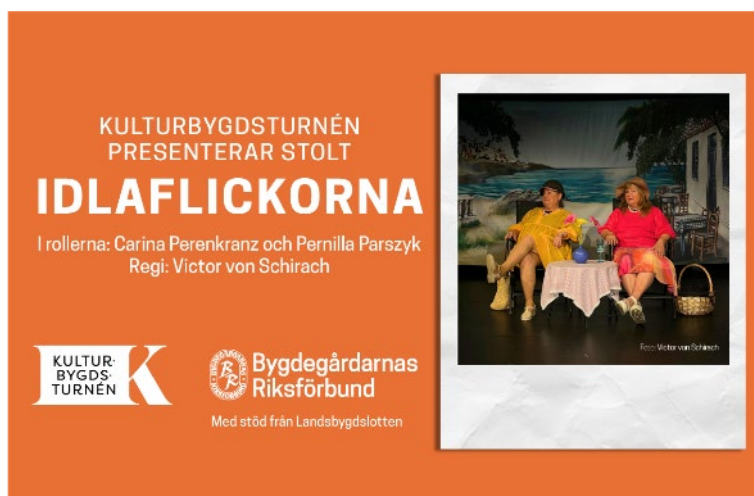
Bild att skicka med pressmeddelande eller använda på hemsida

Det finns en högupplöst för mediaanvändning och en lågupplöst för webb.