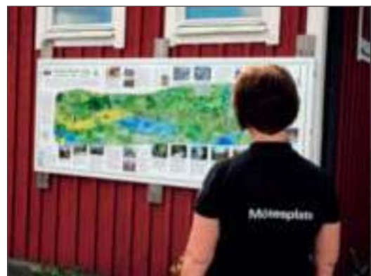
En välplacerad informationstavla med karta och beskrivning av sevärdheter i bygden ger ett gott intryck på gäster och besökande.