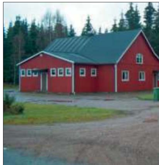
Det var inga stora förändringar som gjordes vid Dalsk...

– Vid Mo bygdegård ordnas ett stort arrangemang i slutet av sommaren varje år med många besökare, Modagen. Då behövs en marknadsplats och parkering. Men det är inte så roligt att se tomma ytor vid andra tidpunkter. Då handlar det om att hitta andra funktioner för