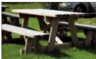
Enkla utemöbler, men praktiska och efterlängtrade.

När hon har pratat med bygdegårdsföreningarna har hon påtalat att man ska tänka på hela miljön, inte bara renovera byggnaden.