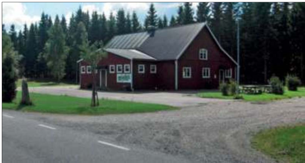
og, men de påverkade ändå intrycket på besökaren – man flyttade soptunnan, planterade några träd och satte upp en informationstavla.