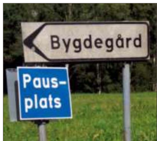
Bygdegården är en bra plats för vila och rekreation.

Hon pratar också om att det är viktigt att titta på hur landskapet ansluter till byggnaden. Det gäller att få till ett välkomnande intryck, lägga ner omsorg vid skapandet av en entré. Kanske bara ge-