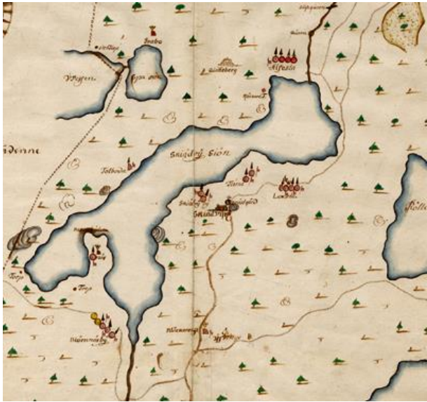
Del av sockenkarta över V Skedvi socken 1688