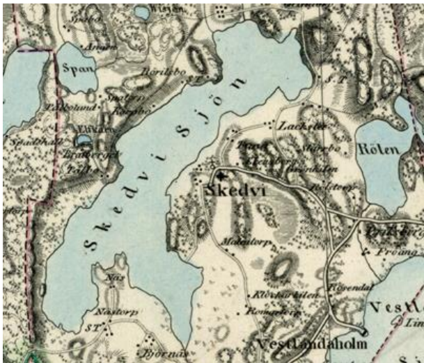
Del av Generalstabskartan 1840