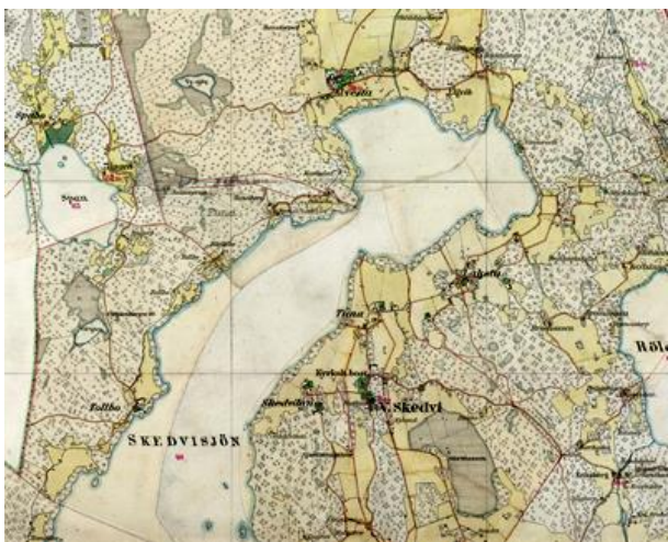
Del av Häradseconomiska kartan 1846

Kartorna ovan kan laddas ned från Lantmäteriets hemsida: Historiska Kartor och Akter (lantmateriet.se) Där finns också skifteskartor, geometriska avmätningar mm.