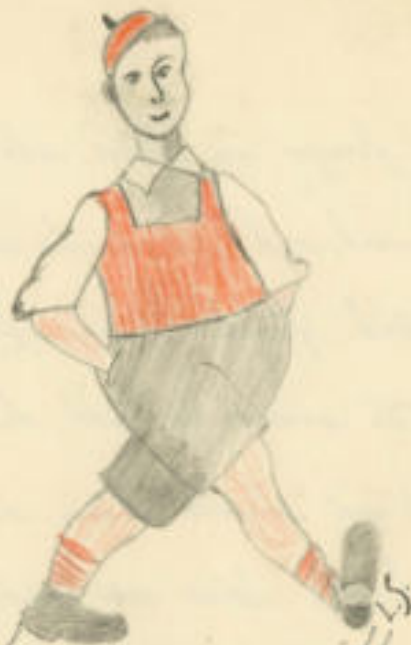
Människan som jag mötte

Det finns många slag av människor. Någ har jag mött många men inte minns jag alla.