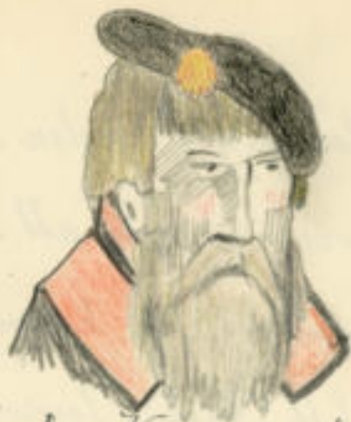
Gustav Vasas äventyr.

Gustav Vasas äventyr är ganska intressant. Han var född på Lybboholms slott i Uppland den 14 maj 1496. Han var av en gammal svensk ätt. Hans fader var riksråd. När Gustav blev så gammal att han skulle gå i skola, gick han först i Uppsala. Sedan följdes han till hovet, till sin frände Sten Sture d. y för att lära riddarliga idrotter. Han var då omkring 18 år.