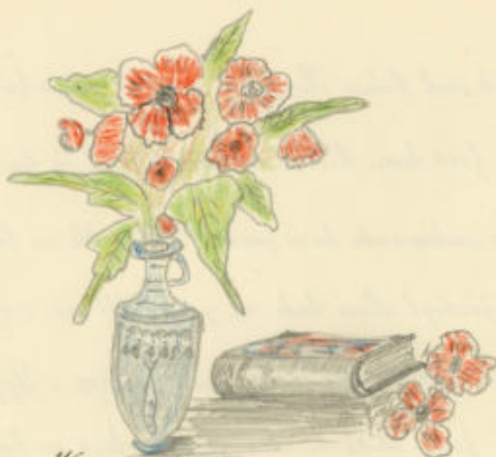
Karl von Linné.