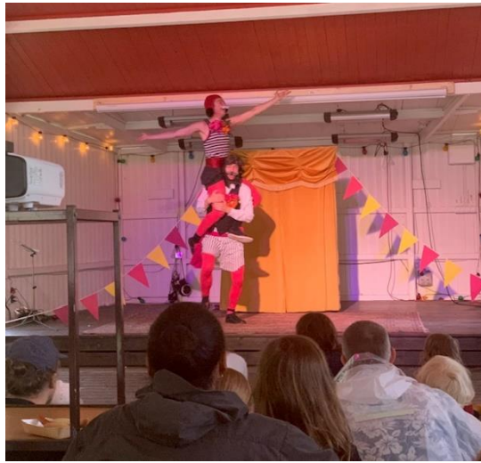
Teater Trattofon på "Barnens dag" Skå festplats, på Färingsö.