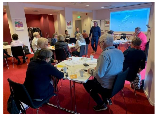
Den 16 – 17 oktober höll vi en tvådagarskurs kring Föreningsutveckling och aktuella frågor.