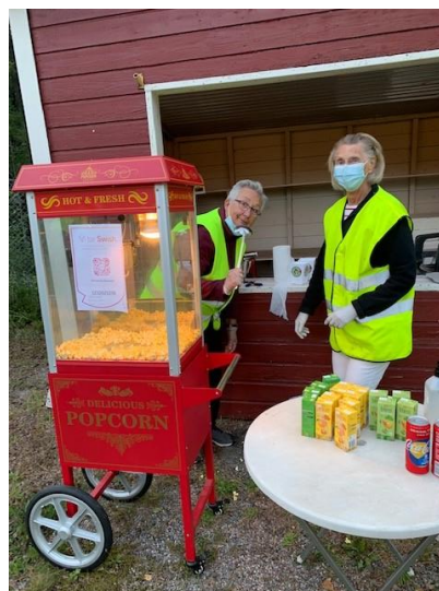
Självklart såldes det popcorn!