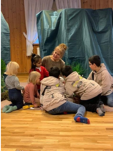
Teater Tummeliten spelar Den fula ankungen på Jakobsbergs gård i Bredäng. på Färingsö.

I en extra satsning och i samarbete med Riksteatern regionalt och lokalt har vi kunnat ge stöd till 18 föreställningar med barnteater. Åtta olika grupper har medverkat.