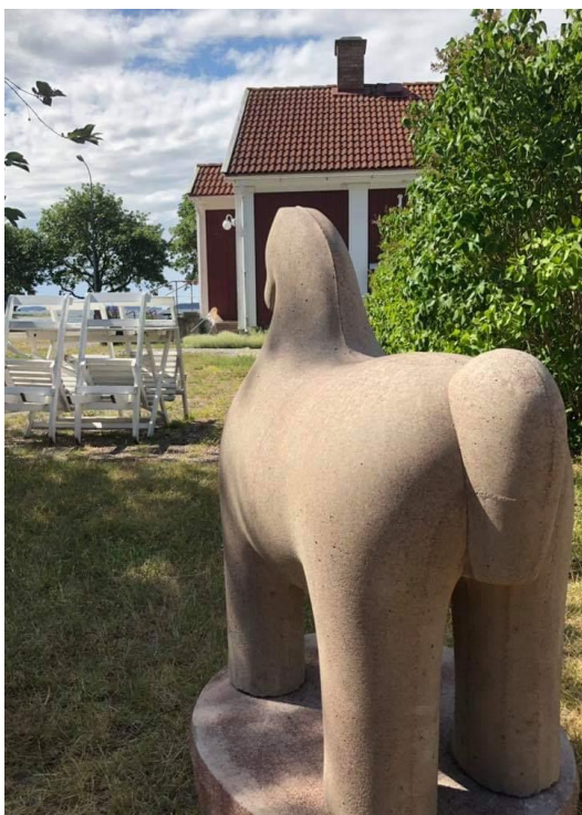
Hästen Twingle köptes in till bygdegården

Oaxens bygdegård i Södertälje kommun storsatsade i somras. De har haft caféservering och konstutställningar i flera somrar men storsatsade denna sommar med tre utställningar från midsommar till mitten av augusti. Normalt har man sitt sommarcafé, med hembakat, bara öppet under helger. Under pandemin arrangerade man många fler dagar för att erbjuda många att komma ut till Oaxen och möjligheten att se utställningarna utan att trängas. Servering skedde utomhus och noggranna regler hölls för insläpp till utställningarna. Det blev en succé sommar. Ca 700 personer besökte utställningarna.