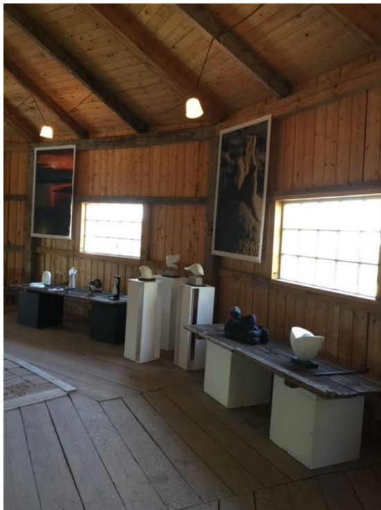
Skulturutsällningen hölls i den intilliggande masugnen.