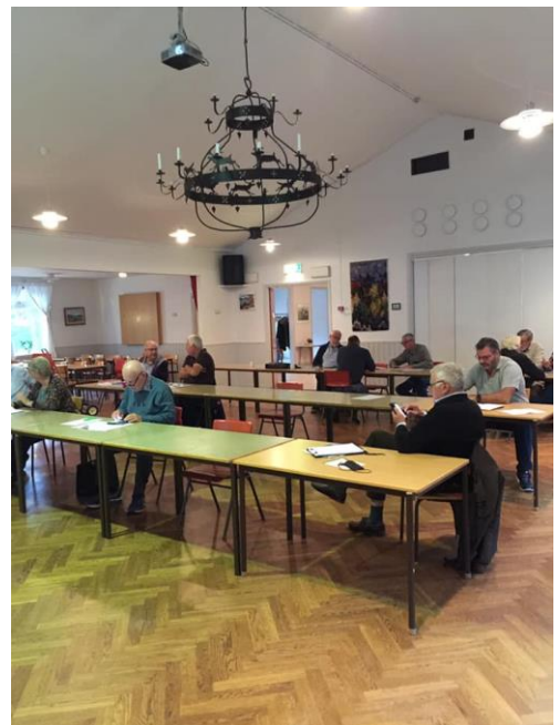
Byggträff i Länna bygdegård

En digital kulturnätverksträff hölls den 7 november med 15 deltagare från 8 föreningar. Medverkan av Jörgen Bodner från Berättarnätverket.