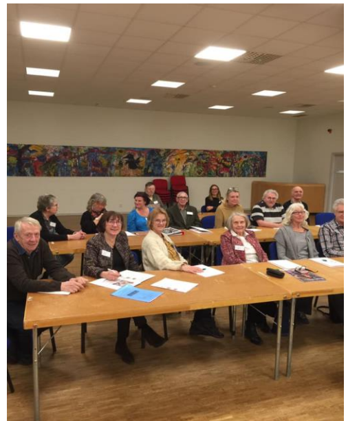
Kulturnätverksträff i Lidingö Föreningsgård.