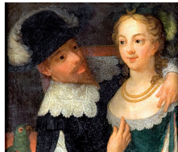
Gustav II Adolf och Ebba Brahe.

Många sägner florerar om Ebba Brahe där hon beskrivs som en god och ärlig kvinna.