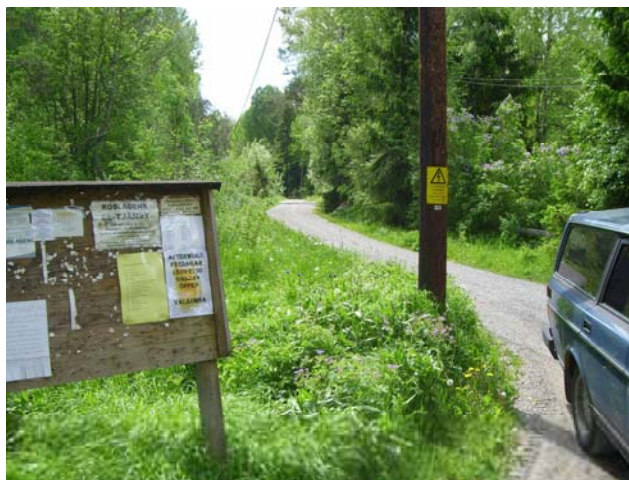
Lövvägen, vars tre fastigheter sedan 2011 ingår i Bro Jarls väg.

I stället bildades en vägförening för 1:12 och 1:13, inklusive fastigheterna norr om Norrsjön, som skulle ansvara för väghållningen och parkmarken, hur vägnätet skulle byggas ut och med vilken standard och när detta skulle vara klart. Tomtföreningen blev kvar som självständig förening för att sköta badstranden och olika slags fester. Norrsjöns vägförening skulle också betala en årlig ”slitageavgift” till Sättra samfällighet för användningen av dess vägar.