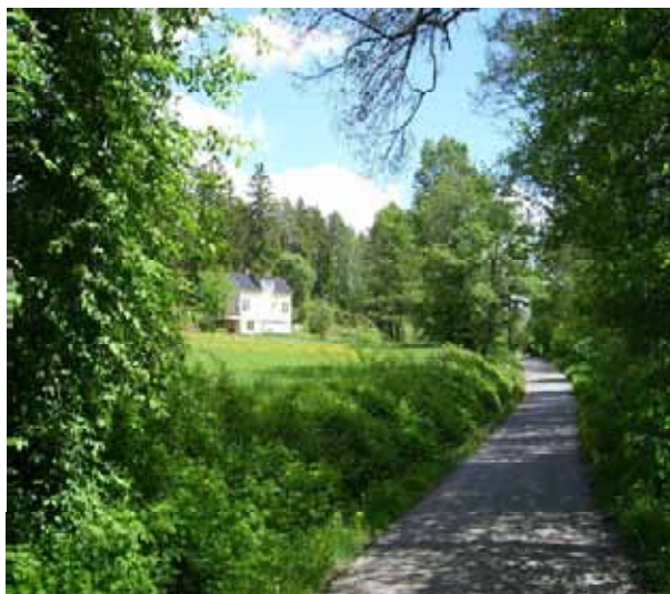
Bro Jarls väg. I huset bodde tidigare snickaren "Roten" Erik Jansson med familj.

Förändringarna av bondbyn och dess tillväxt kan också avläsas i att det stora antalet ridhästar och hundar har ersatt bondens tamboskap. Bildandet av Norrsjöns vägförening kan också ses som ett uttryck för växlingen mellan den ”gamla” och den ”nya” tiden i Sättra.