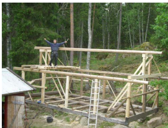
"Ladan" har fått nockstocken på plats.

Det var Åke Dahllöf som blev Lars första nya kontakt i Sättra, eftersom han behövde hjälp med att fälla granar, så att de kunde göra om den sjönära bebyggda delen av marken till en användbar tomt. Ett stort antal stora och medelstora granar har sågats på plats för att bygga hus med. Men mycket har också gått till ved, främst till villan i Täby.