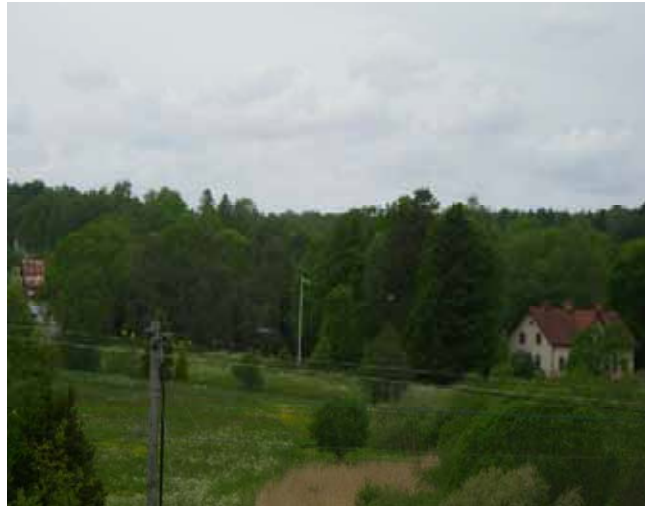
Nedregården, ett av Sättras två hemman under 1700-talet. Längst till vänster skimtar "kiosken" vid infarten till sommarstugeområdena från Rialavägen.