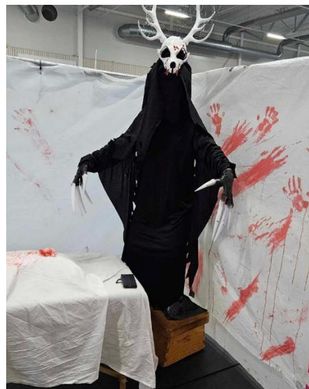
Bild 5 och 6. En lite inblick i hur skrämmande spökvandringen kan vara.