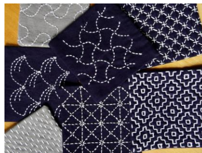
Bild 2. Bild på färdigt arbete i sashiko