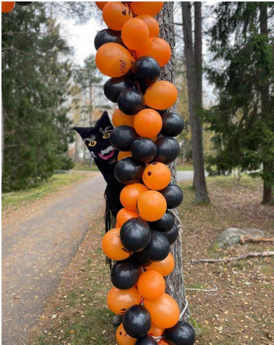
Bild 1. Sommarskuggan besökte årets spökvandring.

Under året har styrelsen haft 12 möten, alla med full beslutanderätt. Närvaron har uppgått till 76 %.