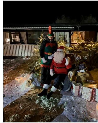
Bild 7 och 8. Under årets adventskalender hjälptes vi åt att dekorera en adventskrans och fick möjlighet att personligen lämna över sin önskelista till tomten och hans nisse.