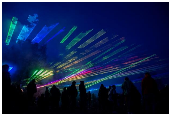
Bild 3 och 4. Valborgsfirande i Ransta 2023.