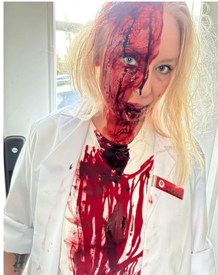
Bild 4 och 5. Årets spökvandring.