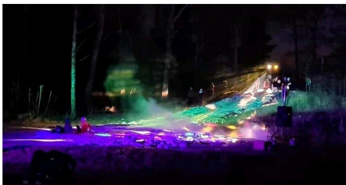
Bild 2 och 3. Olivia i full fart på Ungdomsstationen och pulkadisco