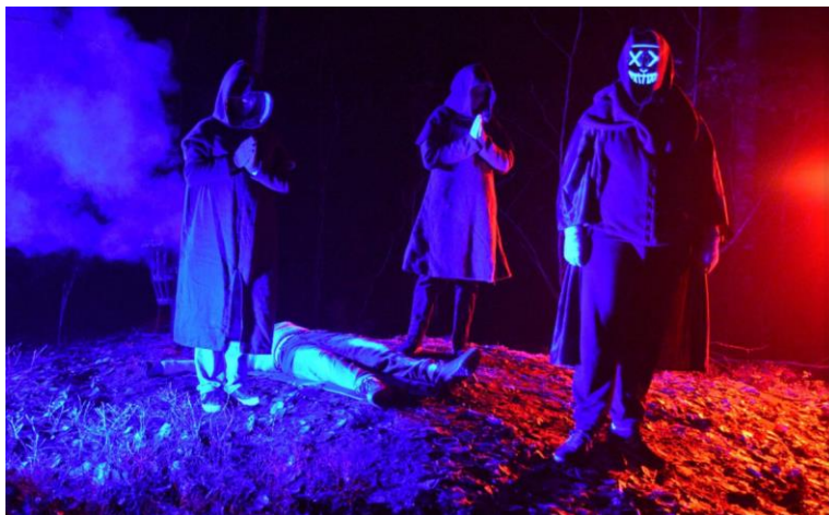
Bild 2. Aktörer i spökvandringen.