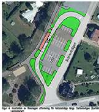
Skiss på ny busshållplats och 3500 år gammalt hållristat klövspår