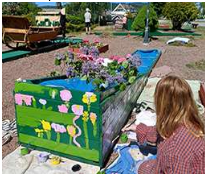
En station i Gröna Golfen är nu full med blommor.

En solig dag i slutet av maj blev barnen på fritidshemmet Rödingen bjudna till Gröna Golfen. Lovisa Lindstrand hade laddat med penslar och färg, skyddskläder, sopkvastar och verktyg. Barnen blev indelade i grupper och turades om att måla eller att städa golfbanor och rensa ogräs.