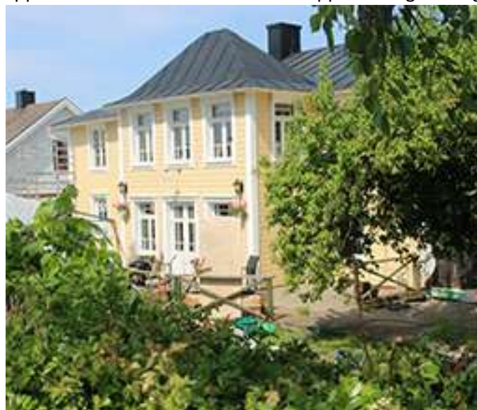
Vätterhästen återfår sin ursprungliga färg. Det blå är borta och huset är åter gult.

Nu vet vi mer. Det blir öppet café med lättare rätter och bordsbeställning för större måltider, som till exempel schnitzel. Dessutom ska Vätterhästen inte bara hålla öppet sommartid. Året om blir det öppet lördag-söndag.