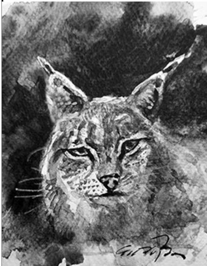
Det är svårt att fånga ett lodjur med en kamera men vad gör det när konstnären Gunnar Gebbe Björkman målar ett djur till en bild

Att Omberg i modern tid nu fått uppleva besök av ett lodjur känns både spännande och överraskande. Berget har därmed höjt sin naturstatus ytterligare ett snäpp och vi som bor i bygden och alla turister är nu att gratulera. Gebbe