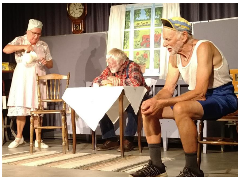
Bottarveteatern gästade Othems bygdegård i augusti i år med sin föreställning "Gretas Mupedn".