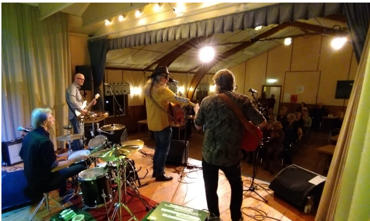
Våren 2022 uppträdde De Lyttas Kapell på Dalhems bygdegård.