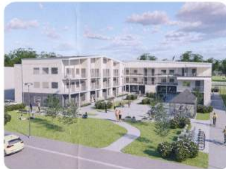
Vy från norr med torget t. v. och villor t.h.