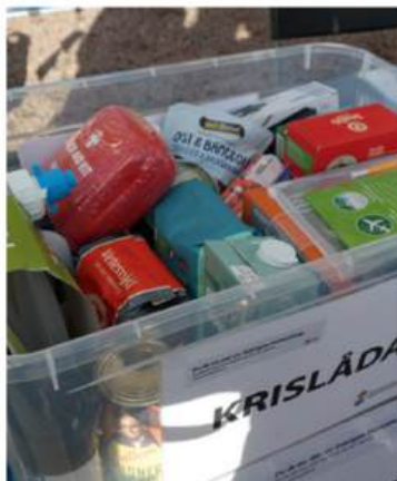
Krislåda bör finnas i varje hushåll.