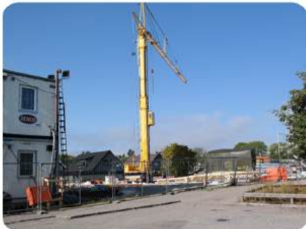
Så här såg byggarbetsplatsen ut i september 2024.