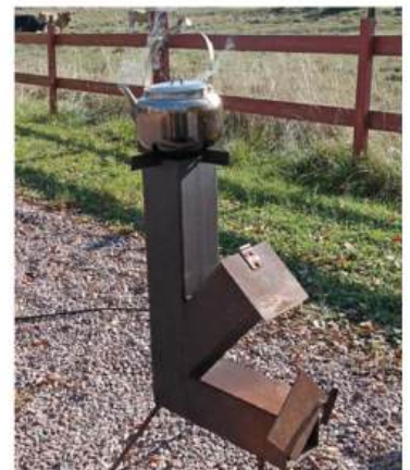
Liten behändig kamin som eldas med ved. Utformad och tillverkad av Ingvar Nilsson.