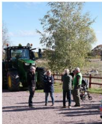
Traktorn t.v. driver en generator som försörjer bygdegården med el.