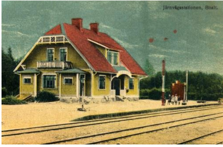
16. Boalts station