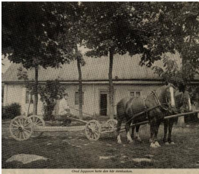
24. Stenvagn. Troligen i Ekeröd.