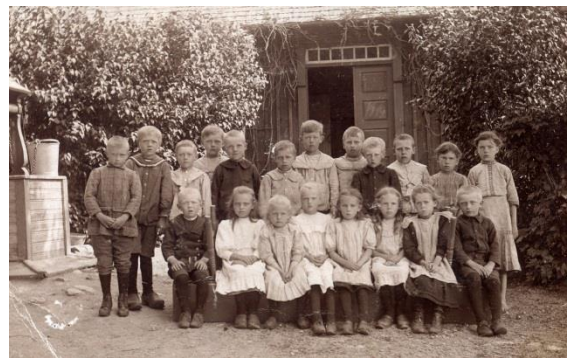
28. Skolkort från Boalt Bilden troligen tagen vid Baltes gård. Kanske tagen någon gång mellan 1910 -1920