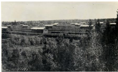
10. Normans myr