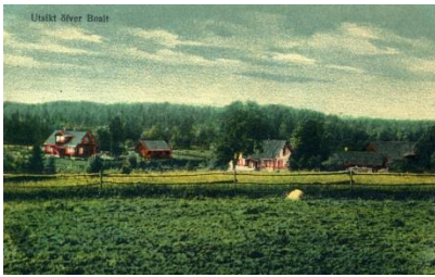
1. Utsikt över Boalt. Huset till höger är Collins eftertr. Elis Lundqvist (affären)