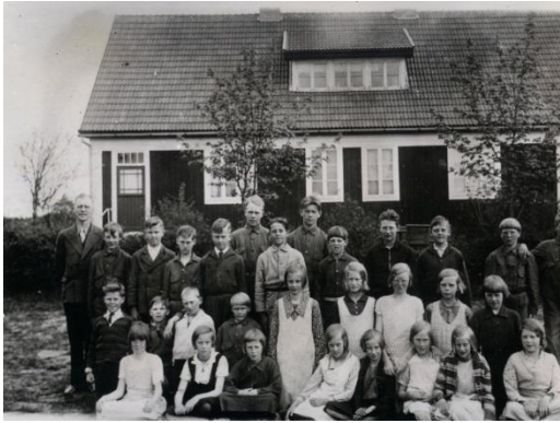
29. Boats skola Skolklasser någon gång från 30-talet