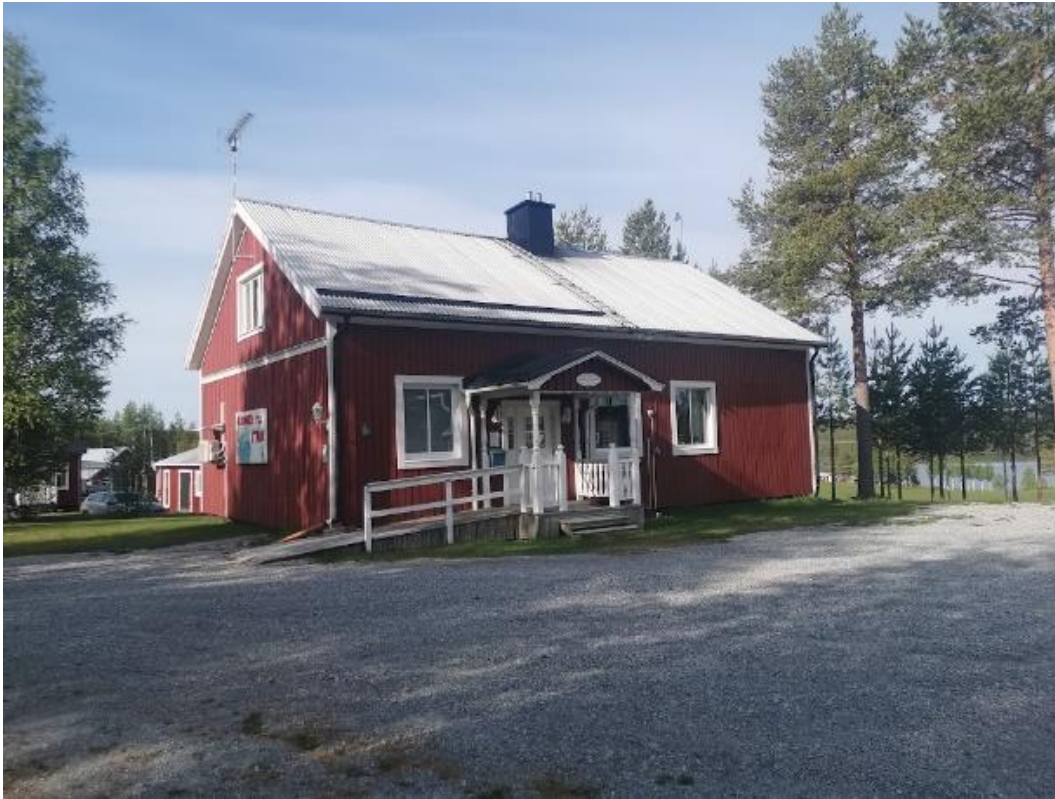
Bygdegården i Åträsk den gamla skolan.

Åträsk bygdeförening har anor sedan slutet av 1940-talet. 1947 och bildas ”Åträsk byggnadsförening”, den föreningen kallar man också i protokoll och kassaböcker ibland ”Åträsk ekonomiförening” och även ”Åträsk bygdeförening”. 1967 slutar alla protokoll från ”Åträsk Byggnadsförening”.