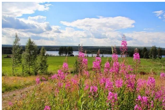
Utsikt från bygården ut över sjön.