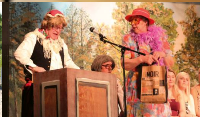
Sketch från medlemsföreningen Böle Ungdomsförenings revy 2018.