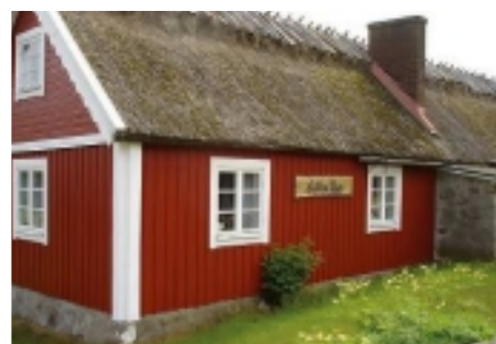
Föreningen förvaltar det historiska "Jullas Hus" som har kulturarrangemang ibland.