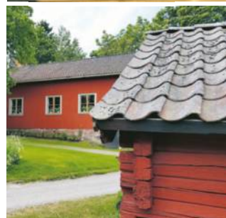
MITT BÄSTA BYGDEGÅRDSMINNE