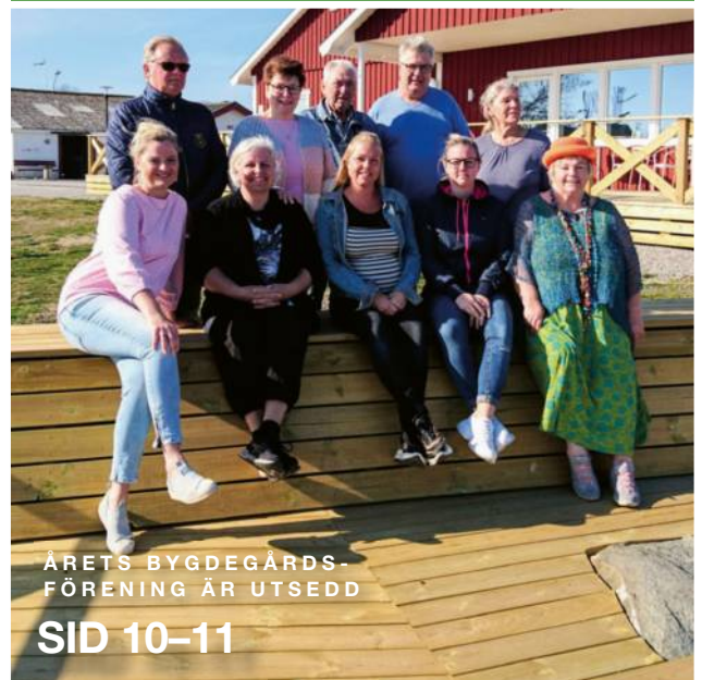
ÅRETS BYGDEGÅRDS- FÖRENING ÄR UTSEDD SID 10-11