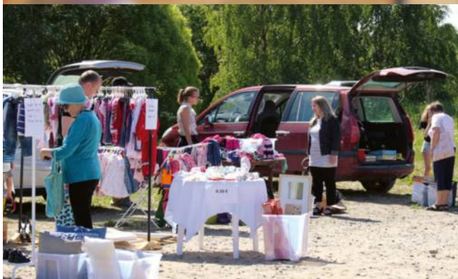
2018 ordnade cirka 40 medlemsföreningar loppis samtidigt runtom i Österbotten.