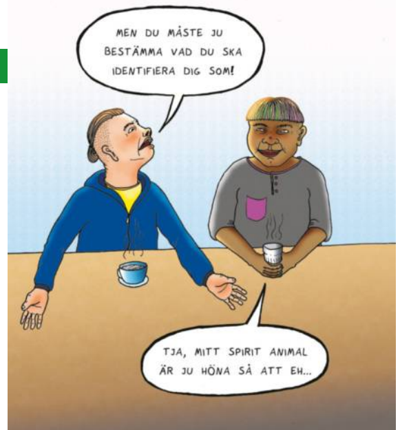
Illustration: Tilda Bergsten