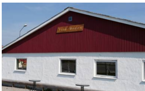
Vita boden i hamnen, en av föreningens samlingslokaler.