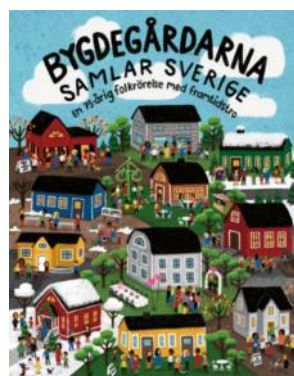
BR:S JUBILEUMSBOK "BYGDEGÅRDARNA SAMLAR SVERIGE - EN 75-ÅRIG FOLKRÖRELSE MED FRAMTIDSTRO"