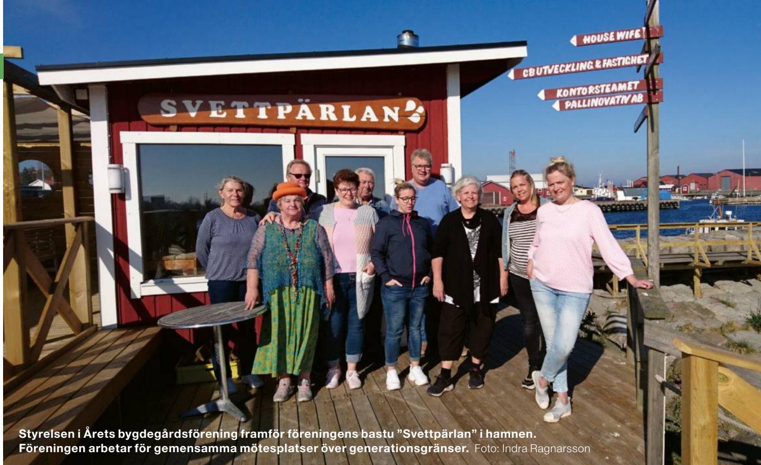
Styrelsen i Årets bygdegårdsförening framför föreningens bastu "SvettpärLAN" i hamnen. Föreningen arbetar för gemensamma mötesplatser över generationsgränser.

lingslokalen Vita Boden på hamnplanen, men bygdegårdsföreningen håller i uthyrningar och aktiviteter. Det är ett utbyte mellan föreningarna där var och en bidrar med sina kunskaper och erfarenheter.