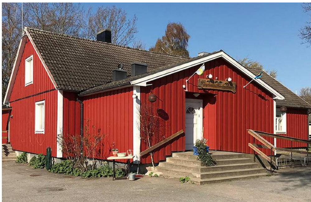
Hembygdsgården, som det heter i Blekinge, byggdes för föreningslivet 1954 mitt i Nogersund. Huset som är stort och rymligt tar in 150 personer samt är tillgänglighetsanpassat. Köket renoverades 2015.