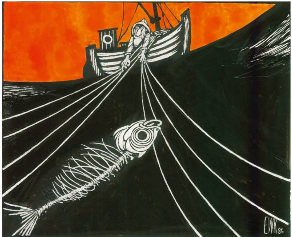
Ett liv i överflöd skapar i förlängningen ingen värld kvar att leva i. Det har länge varit dags att stanna upp och leva i nuet.