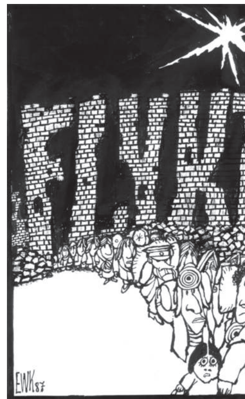
Människor på flykt, som lämnar raserade städer om att hitta en fridfull och välkomnande plats.