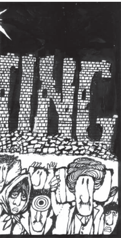
der och länder. Med en förhoppning s