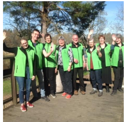
Distriktsstyrelsen samlad för att planera inför förbundsstämman.