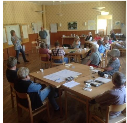
Ett steg till i Yxlan-Blidö bygdegård. Ett led i vårt Leaderprojekt.