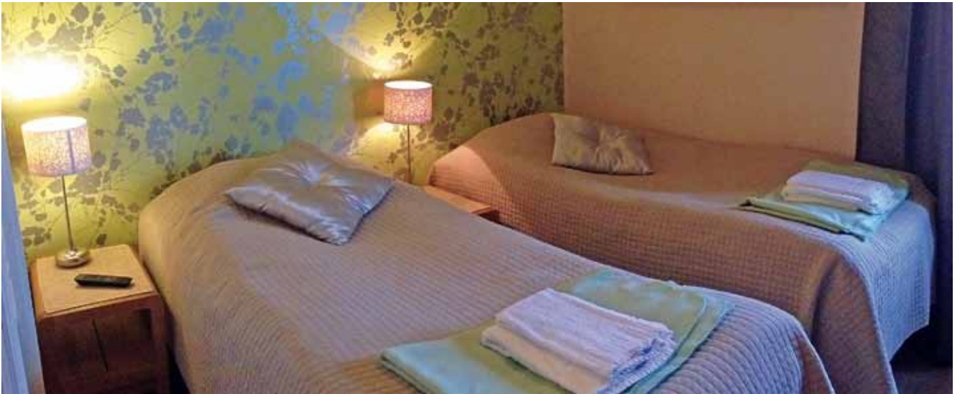
Hotell Vuollerim drivs av ett bygdebolag med 150 delägare. De som vill har fått inreda varsitt hotellrum. Resultatet är underbart personliga hotellrum med poetiska namn. Rummet på bilden heter Vårkväll i Avaudden.

Stojby Bredbands ekonomiska förening, bildades 2009 för den verksamheten.