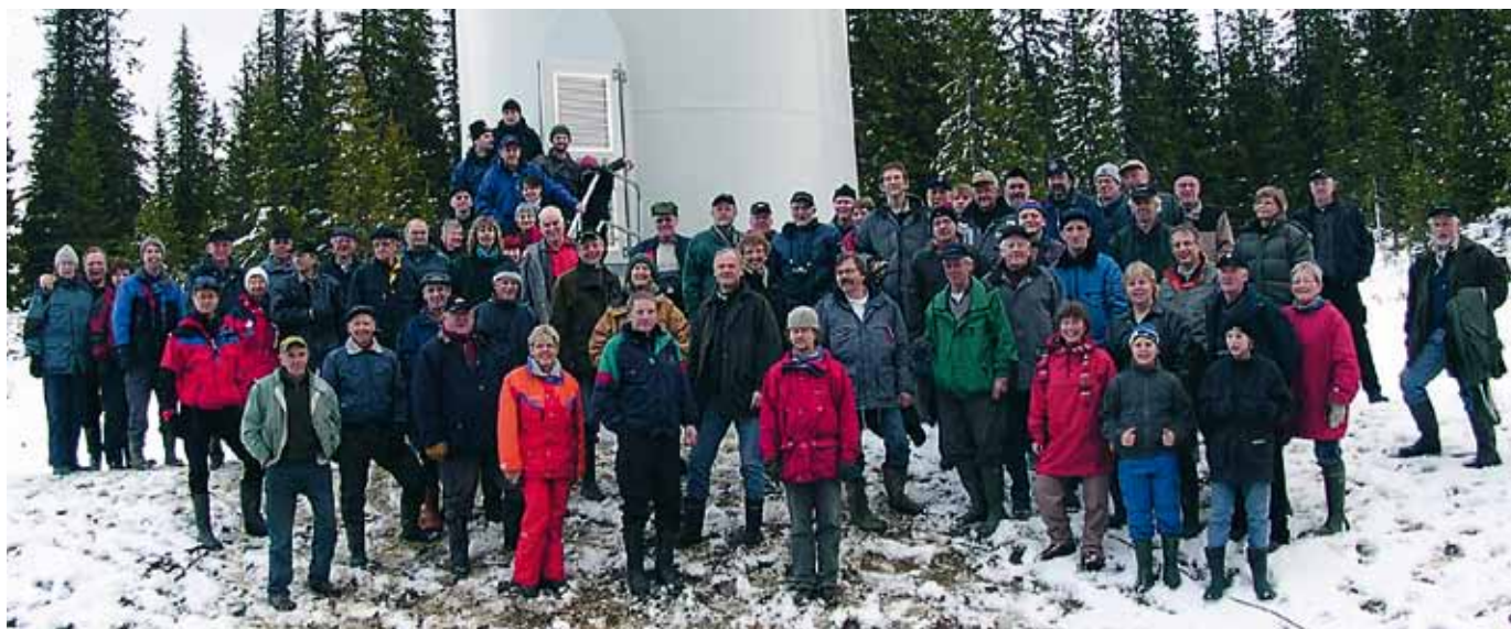
Delägare i Offerdalsvind på studiebesök i det egna vindkraftverket Offelia.

En fond kan alltså ha olika associationsformer, exempelvis Frejas fond som är en stiftelse, medan Mikrofonden för social ekonomi och lokal utveckling har valt att organisera sig som en ekonomisk förening. Det förekommer vidare att föreningar och bolag avsätter egna medel och/eller inbjuder allmänheten att göra donationer till en utvecklingsfond. Flyingefonden är ett sådant exempel.