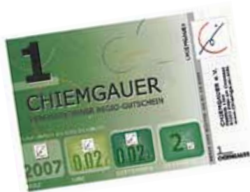
Den lokala valutan Chiemgauer fungerar som betalningsmedel i Priem am Chiemsee, i Bayern.

rörelsens centrum, och i Bristol. Totnes Pound används i närmare 70 lokala affärer och fungerar som en symbol för visionen om ett hållbart samhälle. I finanskrisens spår har det även startats många olika sorters lokala valutor, så som tidsbanker och bytesringar, i Grekland och i Spanien.