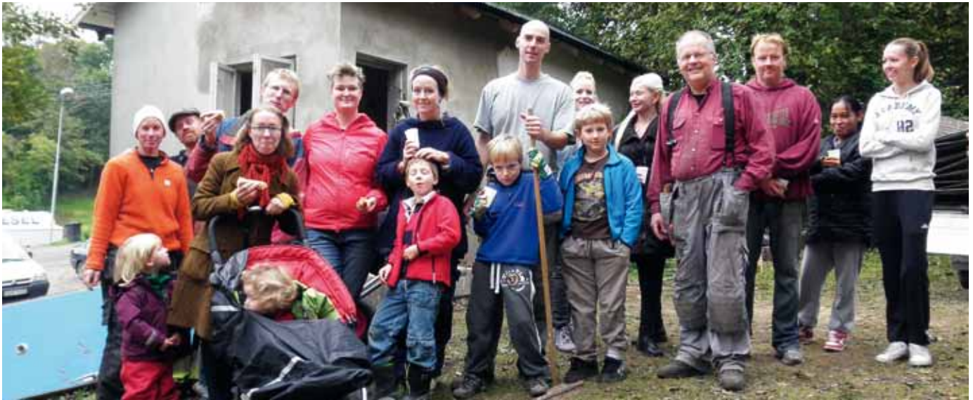
Utvecklingsbolaget Röstånga Tillsammans under en av sina många fixarhelger. Den här gången renoverades det gamla före detta fryshuset för att så småningom förvandlas till Skånes minsta konsthall på 18 kvm.