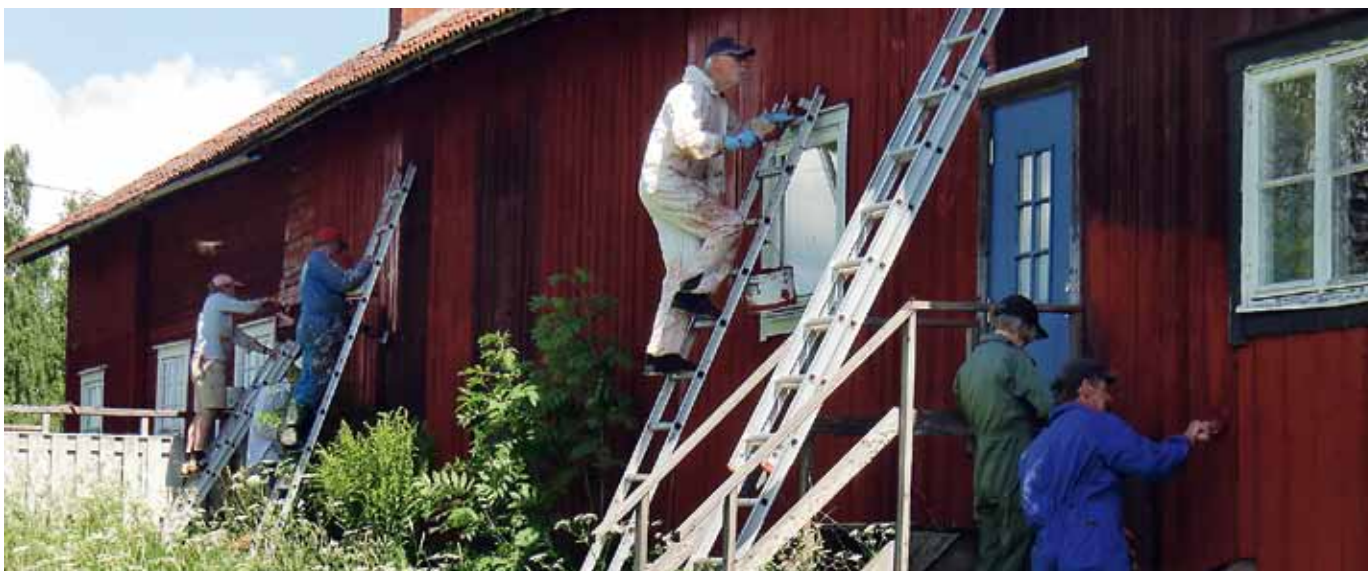
Delägare i Tiveds utveckling AB målar tillsammans om en av bolagets vandrarhemsbyggnader under en gemensam arbetsdag.

En spar- och låneförening ska ansöka om registrering enligt lagen (2004:299) om inlåningsverksamhet, samt anmäla verksamhet enligt lagen (1996:1006) om anmälningsplikt avseende viss finansiell verksamhet. En spar- och låneförening är alltså både ett inlåningsföretag och ett finansiellt institut.