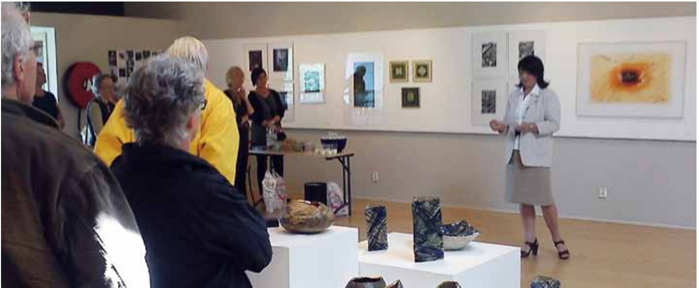
Konstnärskollektivet Tingsrydgruppen finansierade delvis sin vandringsutställning med Crowdfunding. Här är det vernissage på Smålands museum i Växjö.