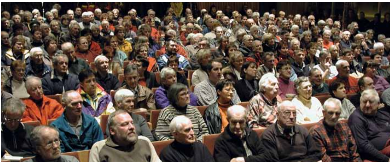
På det första informationsmötet för Hälsogemenskap AB i Jörn fylldes Folkets Hus till bristningsgränsen med engagerade invånare

kunskap och kapital möjliggöra bolagens utveckling till nästa tillväxtfas. Vidare finns tillväxtkassan Startkapital i Norr AB som är ett samarbete mellan 20 privata investerare som tillsammans satsat 5 miljoner kronor. I Sikås har tre företag bildat en tillväxtkassa, Vindpenningen AB, som satsar på att utveckla bra företagsidéer i byarna kring vindkraftsparkerna i Munkflohögen och Raftsjöhöjden. Företagen bakom vindkraftsverken har satsat 1,5 miljoner. Och i Söderhamn finns ett lokalt utvecklings- och riskkapitalbolag, Söderhamns Tillväxtkassa AB, som startats av åtta affärsänglar med anknytning till orten. Statliga Inlandsinnovation har bidragit med investeringskapital till tillväxtkassorna.