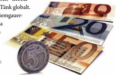
Den lokala valutan Euronäs fungerar i Höganäs kommun.

I Europa har regionala valutor fått fäste i flera av de tyska regionerna. Syftet med valutorerna är att öka den inomregionala handeln. Devisen "Global denken. Regional handeln." (Tänk globalt. Handla regionalt) pryder Chiemgauer-sedlarna, en av dessa regionala valutor. I England finns också flera lokala valutor, bland annat i Totnes, omställnings-