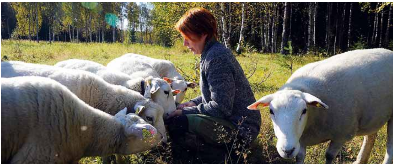
Agrocenter i Gunnarsbyn startades av bybor och utflyttare för att bedriva boskapsskötsel och landskapsvård, eftersom bygden hade slyat igen. Vinsten är lokalt producerat kött och att kulturlandskapet hålls öppet.