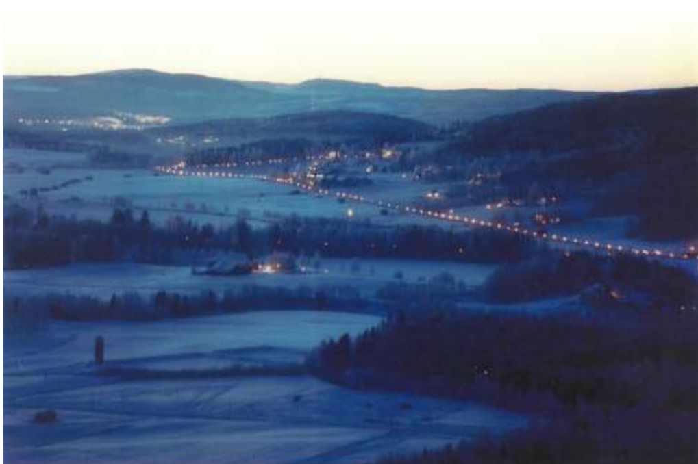
Juldagsmorgon 2002, 07.45, -28 grader.

Ja det var allt för den här gången. Hoppas Du hittat något som intresserade dig bland våra byar. Påverka gärna vad eventuellt nästa nummer kommer att innehålla. Vi som jobbat med denna skrift tar gärna emot tips och ideér. Besök oss också under Bredbydagen den 4 juni. Vi har ett marknads- stånd med lite roligheter då.