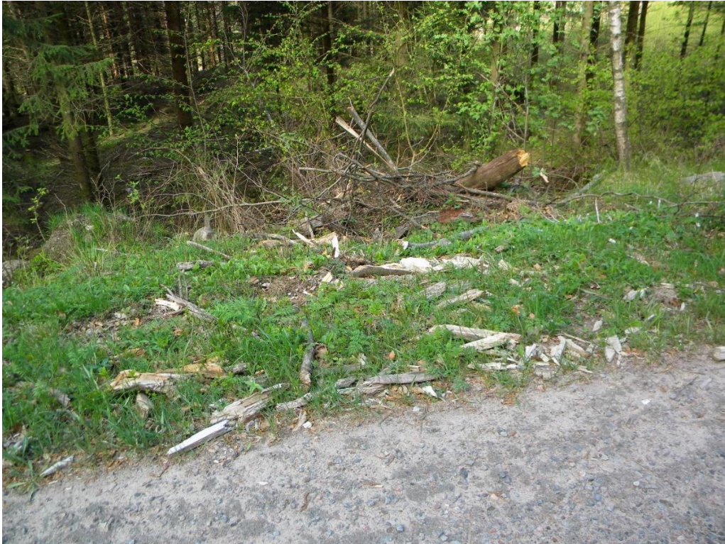
Småbitar efter den fallande tallen.