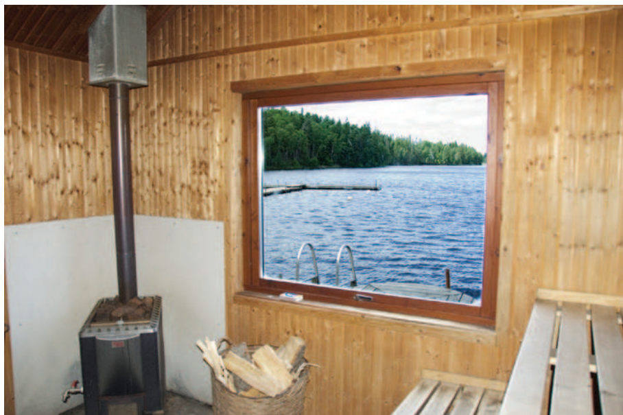
Utsikten från bastun är inte fy skam

1990. Därefter var det Fritidsförvaltningen i Östra Göinge kommun som övertog ansvaret. På hösten 1994 föreslog fritidsförvaltningen att omklädningsbyggnaden, toaletten och en lagerbyggnad skulle rivras. Då engagerade sig ordsbefolkningen,