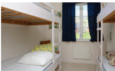
Ett av sovrummen på bottenvåningen