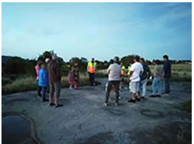
Hällristningarna i Hästholmen är näst störst i Östergötland