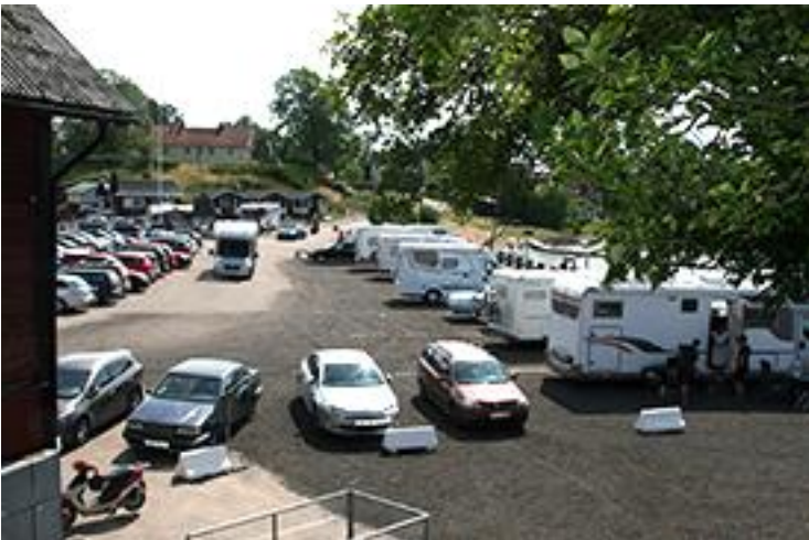
Hamnen kan ibland bli en stor parkeringsplats, här utsikt från Husbacken en dag i augusti.

Sedan i mars finns det en särskilt tillsatt grupp bestående av politiker och tjänstemän från kommunen och ÖBO för utveckling av hamnområdet. Gruppen arbetar med olika scenarier hur området ska gestaltas i framtiden. Några beslut om området är inte tagna.