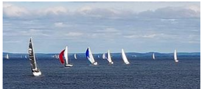
30 segelbåtar deltar i årets Kors och Tvärs över Vättern och första målet är Hästholmen.

På onsdagsmorgonen startade första båt klockan nio och 50 minuter senare var samtliga båtar på väg mot grundet Flisen på Västgötasidan. Var en mäktig syn att se alla båtar sätta spinnakers på startlinjen. Vid Flisen skulle de runda östgrundmärket för att sedan gå i mål i Vadstena. På torsdagen var sista etappen med slutmålet Motala.